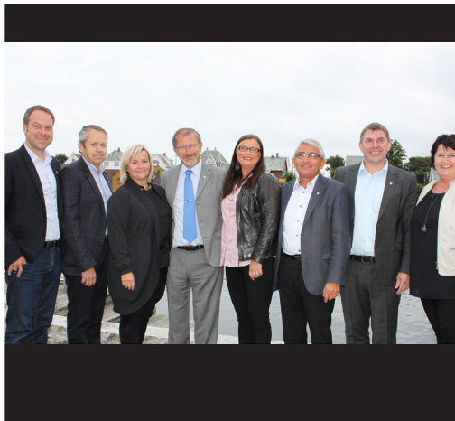
◀ Byregioner 2014 - Haugesundregionen