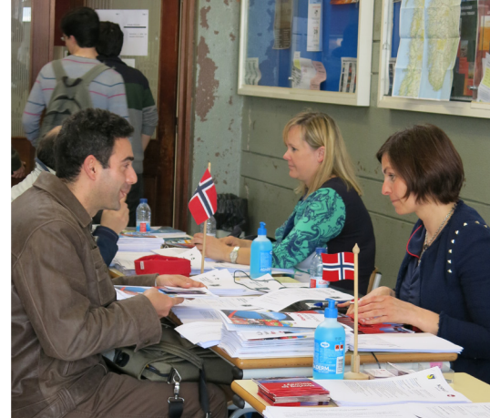
Haugaland Vekst bidro til få tak i ► sykepleiere på jobbmesse i Portugal