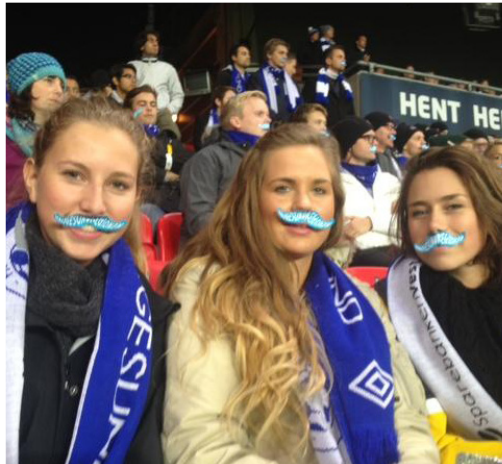
◀ Stemning i «bartebyen» Trondheim da studenttreffet var lagt til Lerkenda!