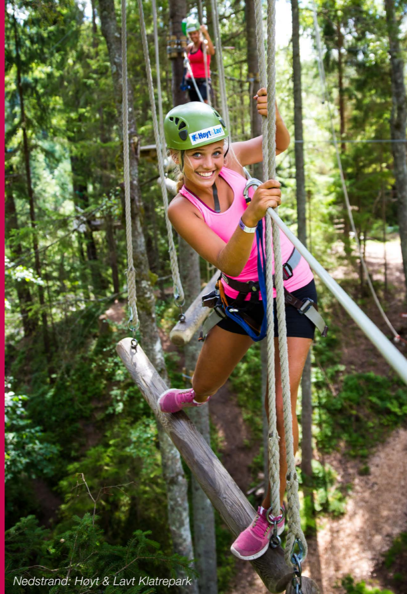
Nedstrand: Høyt & Lavt Klatrepark

Utsira kommune har jobbet med strategisk boligplan og iverksettelse av denne. Et boligstrategisk arbeid vil stimulere nærings- og samfunnsutviklingen og kommunen har besluttet å bruke boligbygging som utviklingsverktøy. Ved god dialog med sentrale næringsaktører i Haugesundregionen, fikk vi på plass flere interesserte utbyggere på befaring til Utsira. Målet var å synliggjøre de muligheter som er på øya og viktigheten av boligbygging for fremtidig vekst innenfor bosetting og næringsutvikling. Haugaland Vekst har, som Utsira kommunes næringsfunksjon, hatt ansvar for dialog og avtaler med potensielle utbyggere.