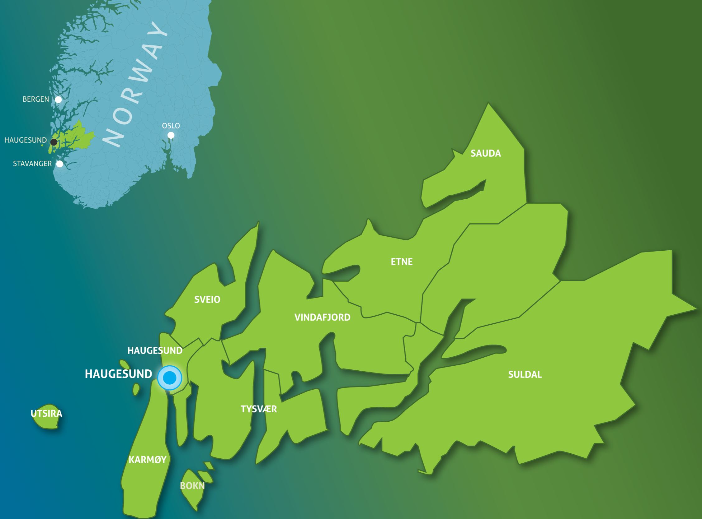
KART: De 10 eierkommunene i Haugaland Vekst