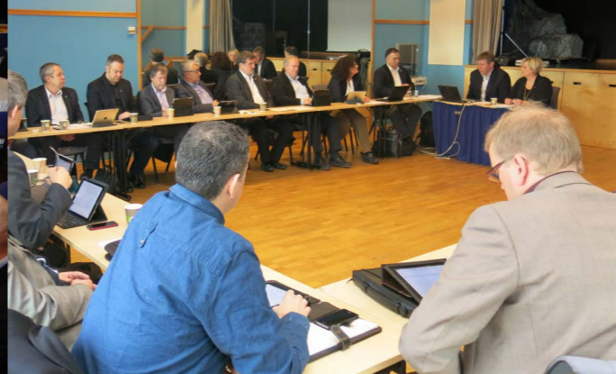
Haugaland Vekst regionråd