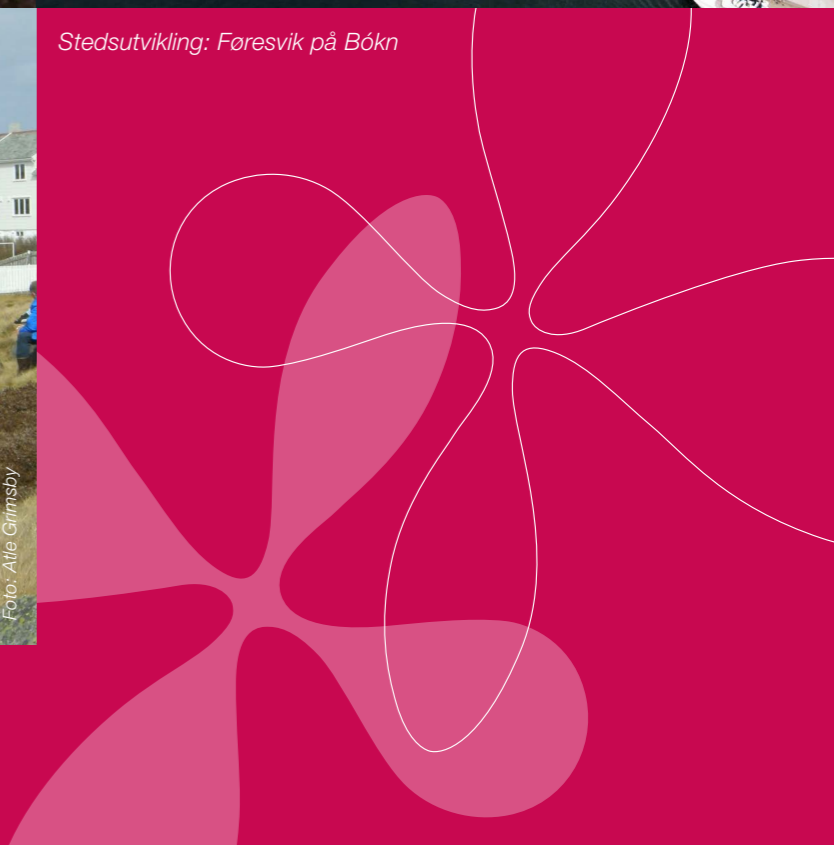
Stedsutvikling: Føresvik på Bókn