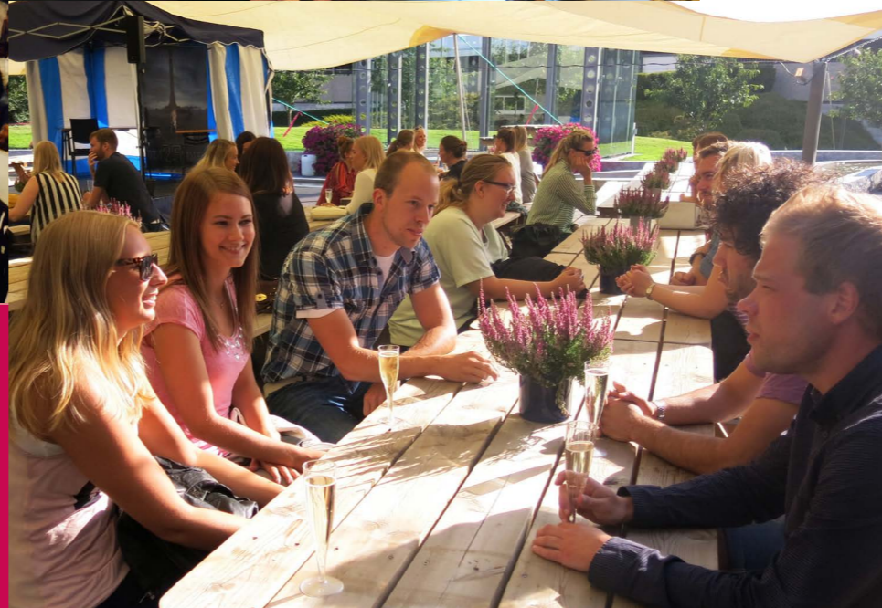
"Ka skjer ittepå?" Vårt arrangement hos Haugaland Kraft