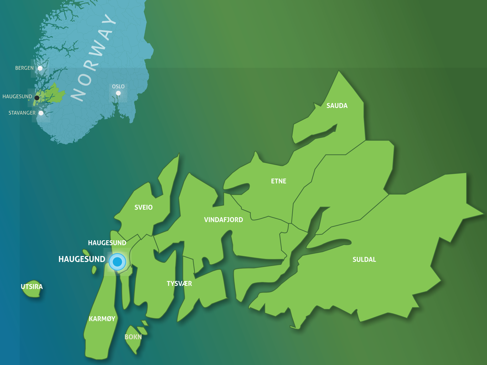
KART: De 10 eierkommunene i Haugaland Vekst