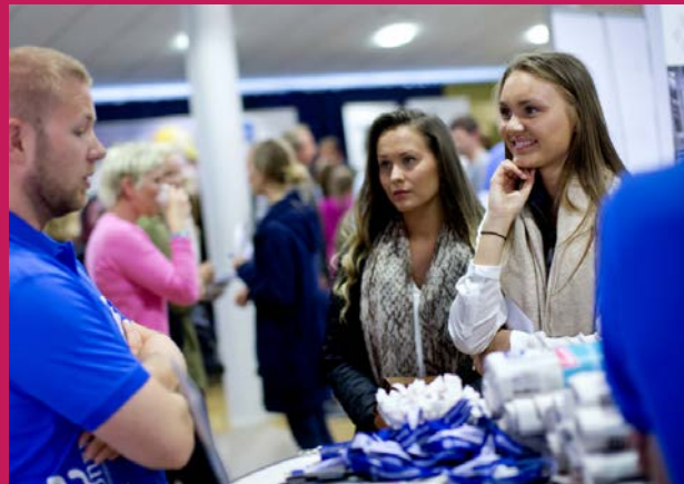
Haugesundregionen Haugaland Kraft