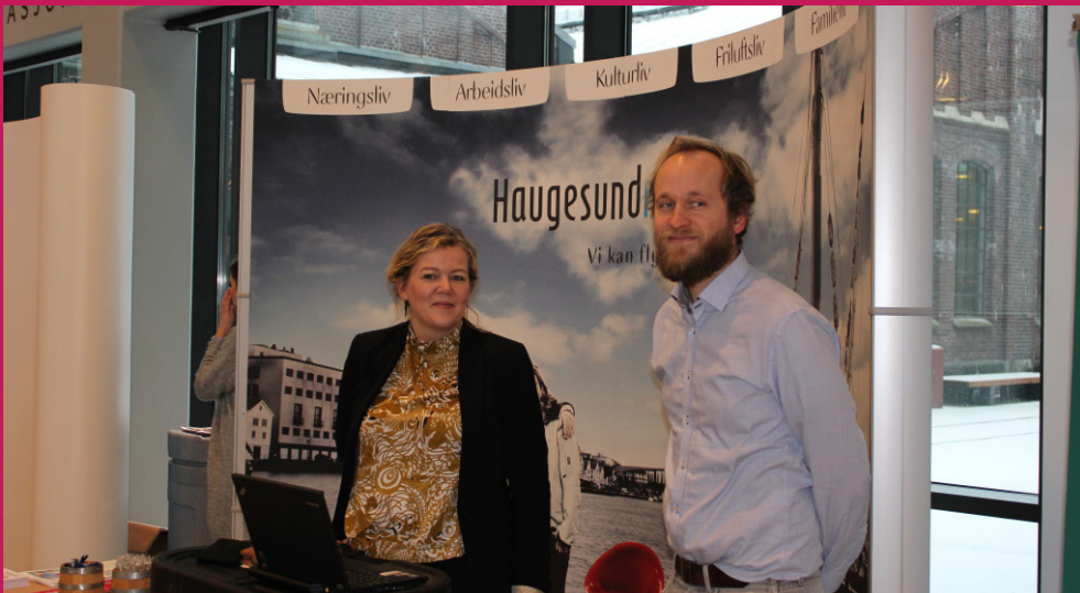
Haugesund og Karmøy sammen på stand i Bergen