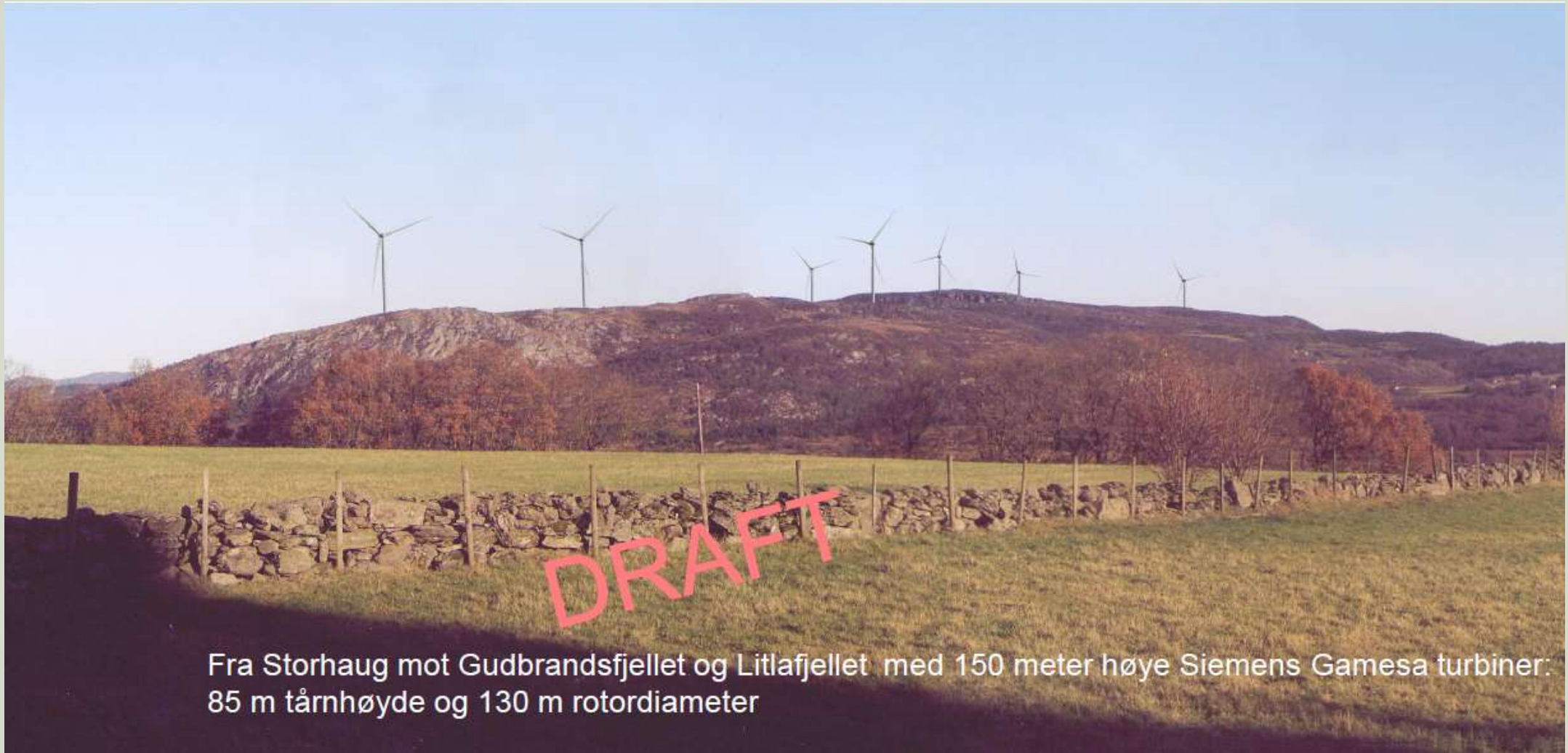
Fra Storhaug mot Gudbrandsfjellet og Litlafjellet med 150 meter høye Siemens Gamesa turbiner: 85 m tårnhøyde og 130 m rotordiameter