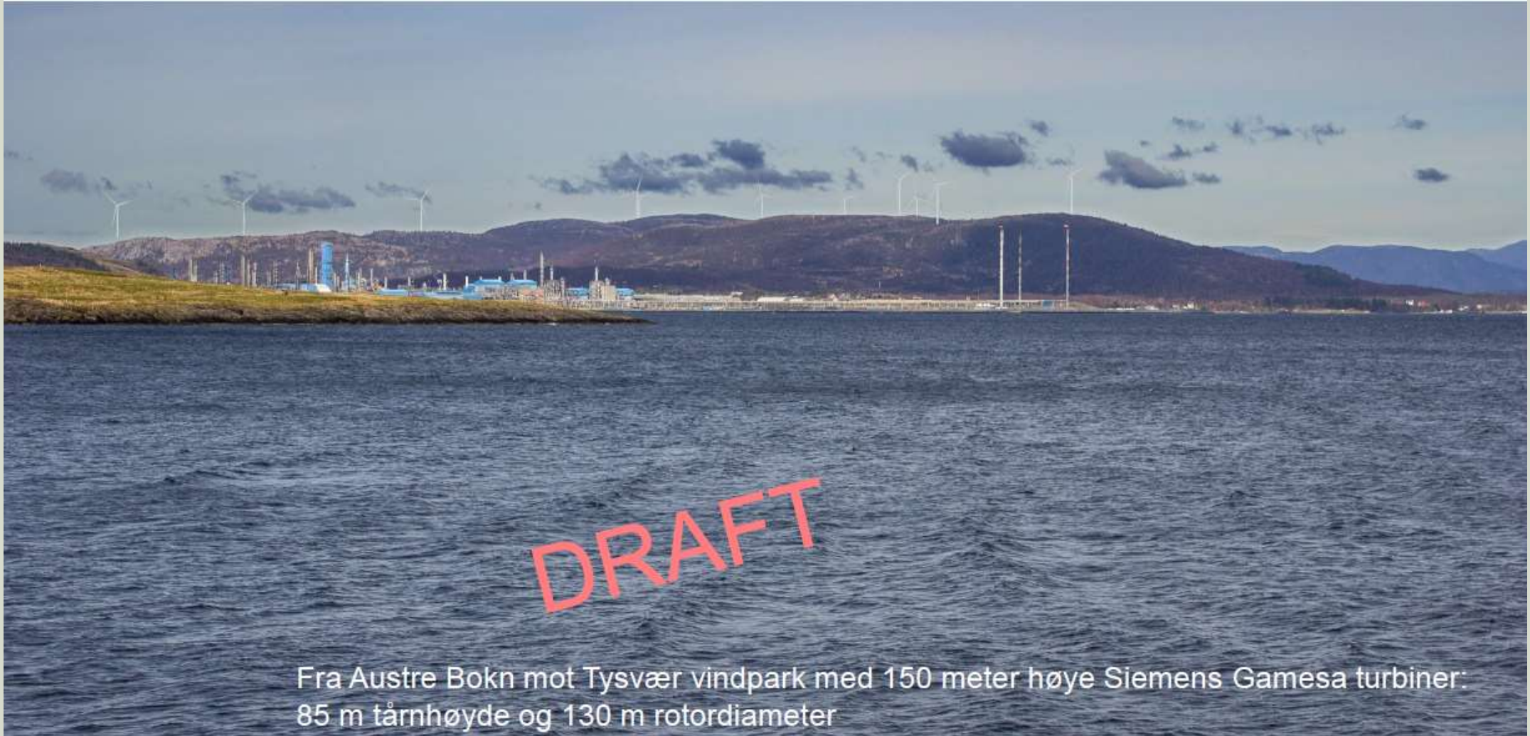
Fra Austre Bokn mot Tysvær vindpark med 150 meter høye Siemens Gamesa turbiner: 85 m tårnhøyde og 130 m rotordiameter