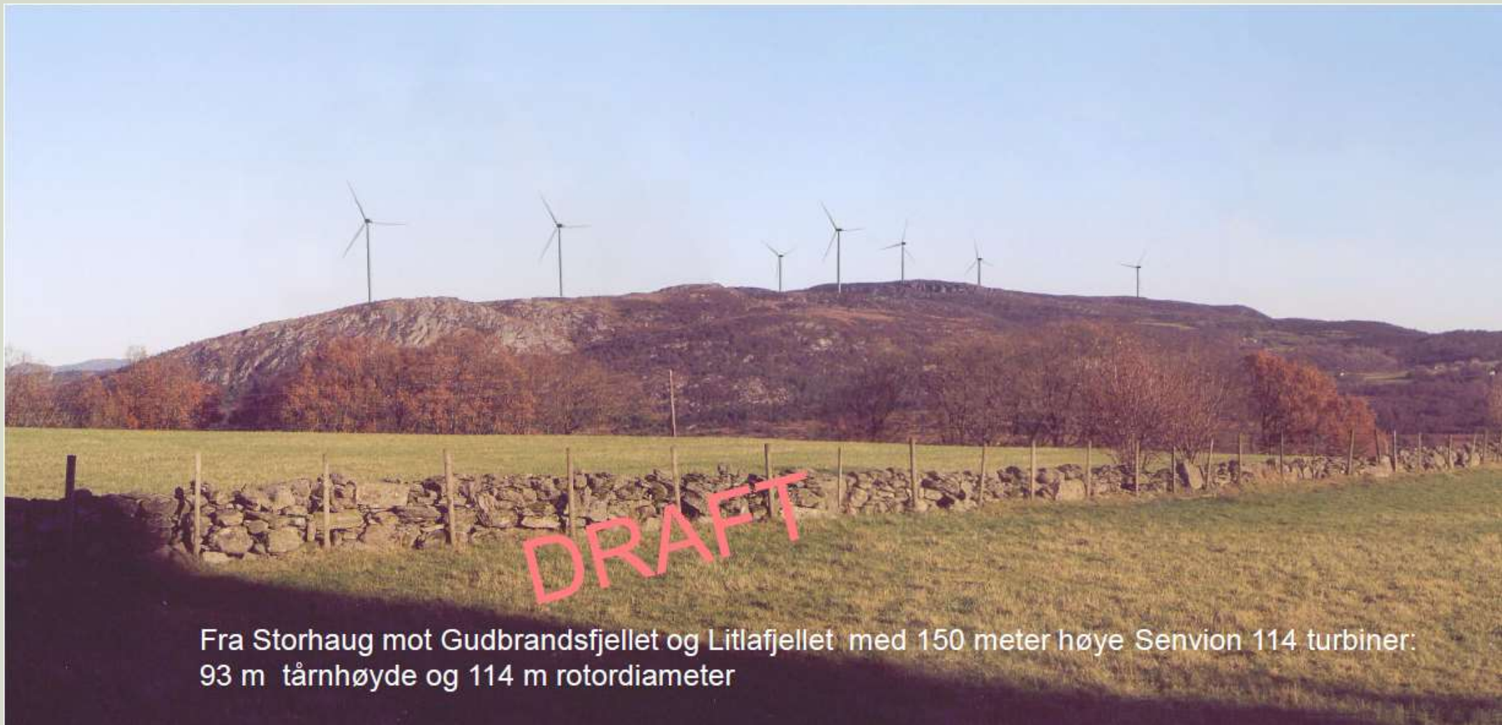
Fra Storhaug mot Gudbrandsfjellet og Litlafjellet med 150 meter høye Senvion 114 turbiner: 93 m tårnhøyde og 114 m rotordiameter