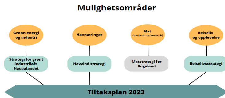
Figur 2 Reiselivets plass i veikartet