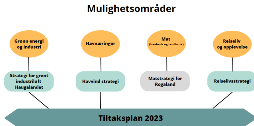
Figur 1 Havvindstrategiens plass i Veikartet for Haugalandet 2021-2025

Strategien oppdateres og rulleres årlig. Første rulling planlegges til høsten 2024, slik at tiltakene legges inn i Veikartets tiltaksplan, slik som skissert i figuren: